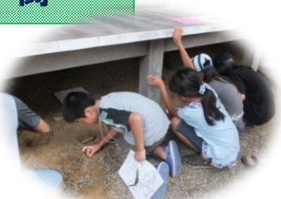
お寺の柱の舌を調べる子ども

問題一では、「このお寺の周囲にある小さな穴はなにでしょう？」三択から選ぶのですが、見たこともないアリ地獄。ついには、実際にアリをその穴に落としてみ、アリが吸い込まれる様子を確認しました。穴の中にはアリを獲物としている虫がいることも確認しました。