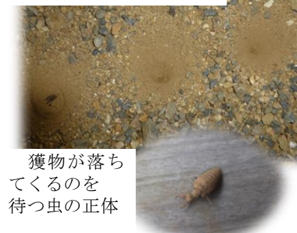
獲物が落ちてくるのを待つ虫の正体